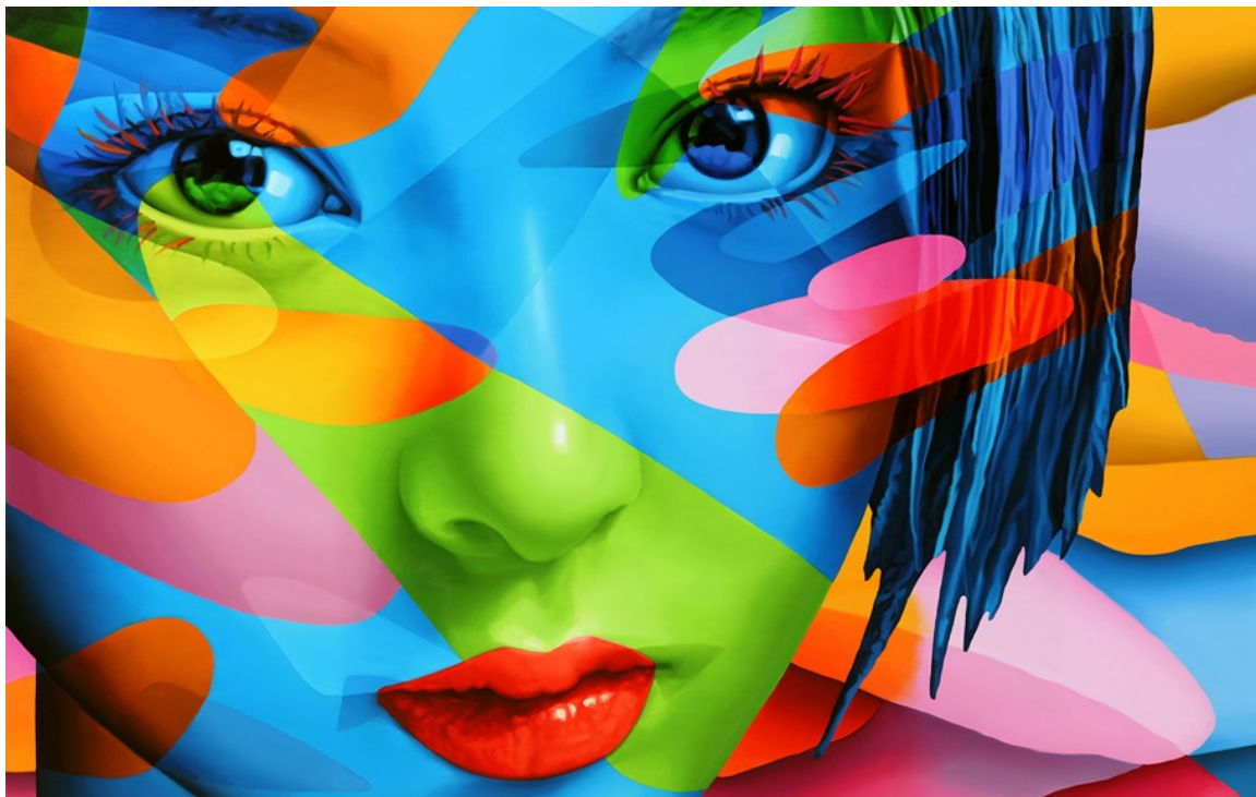
“THE FACE. YUSHIKO” (細節) , GALASASCHA, Galerie Makowski, 德國, 房間 4118