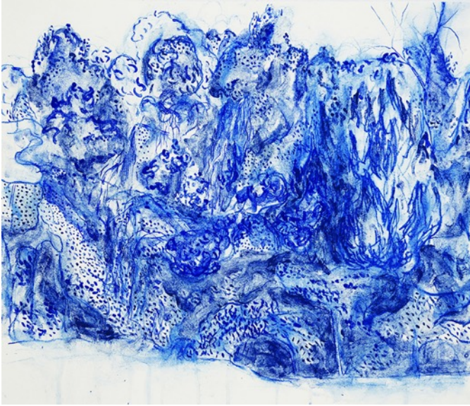
関智生, 日本 - Gallery OUT of PLACE, 房間 4304

関智生 (b. 1965) 來自日本名古屋，他對當地土生土長的植物研究頗深，用藝術的形式把植物的面貌呈現出來。從遠處看，他的作品像是交錯相擁的枝葉與花叢；就近觀摩時，具象的枝葉與花叢則變成了抽象的點與線，挑戰我們對透視法概念以及角度的理解。関智生也會將畫幅延續到油畫布的邊緣，增加作品平面的深度及構圖的複雜性。