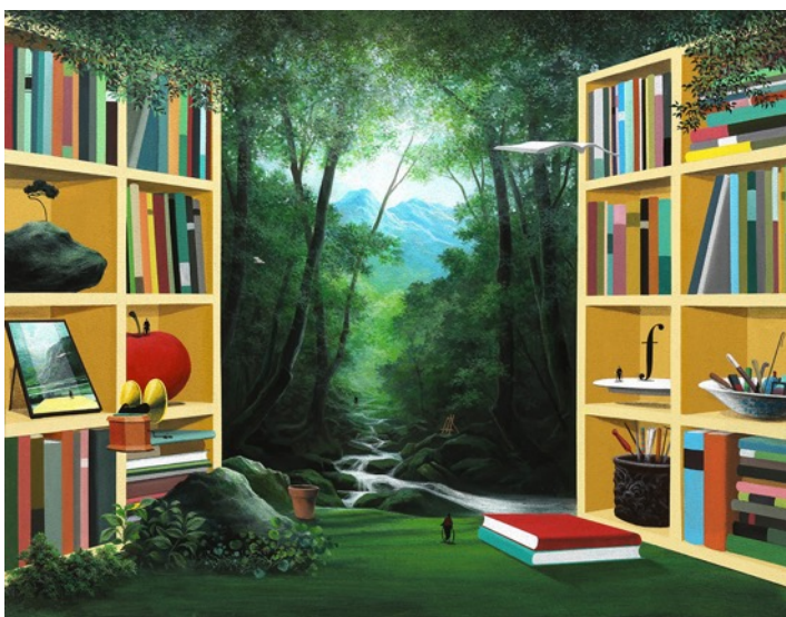
“The Words”，Yoo, Sun-Tai, Galerie GAIA, 南韓, 房間 4306